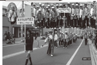
一筆啓上・作左の会 本多作左衛門重次 になって出陣しました。